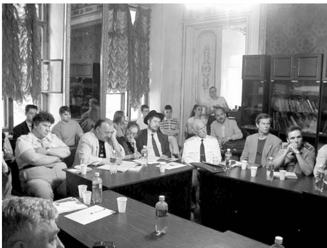
12 июня 2002 года. Участники круглого стола.

Указанным органом, который должен был бы оценивать работу правительства, перед которым хотя бы в материальном плане были бы ответственны и президент, и парламент, мог бы быть «Народный Суд Присяжных по Делах Правительства, Парламента и Президента». Его могли бы составить несколько сот или тысяч человек, выбираемых порегионно случайным образом из населения страны после окончания срока деятельности той или иной государственной структуры.