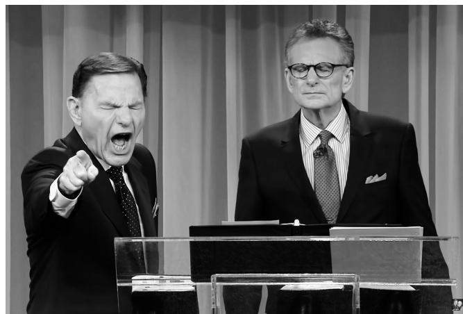
Скриншот с сеанса «изгнания» коронавируса из США телепроповедника Кеннета Коупленда [5]

Анализируя опыт разных стран в области противостояния коронавирусной инфекции, эксперты